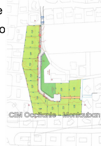
CIM Occitanie - Montauban

e le prix de vente aucune auxquels ce bien est expo