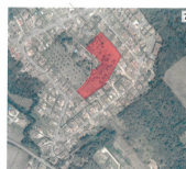
CIM Occitanie - Montauban

e le prix de vente aucune auxquels ce bien est expo